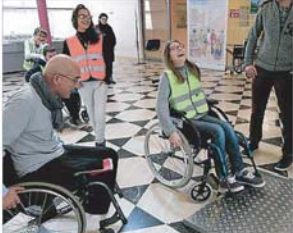
« Une heure pour appréhender les difficultés de quotidien. »

Pour la troisième année consécutive, l'opération "Différent... comme tout le monde" fait découvrir et partager à des élèves de 5 e la vie des personnes en situation de handicap, à travers des ateliers. Durant quatre jours à la salle Pagézy, plus de 1800 collégiens ont eu l'occasion de vivre une expérience extraordinaire qui a été qualifiée d'initiatrice de questions de vivre ensemble avec un handicap.