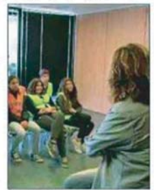
« Le handicap auditif a été expliqué lors d'ateliers. »