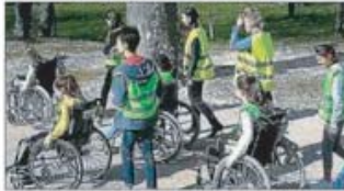
« En fauteuil ou les yeux bandés, les adolescents ont découvert le handicap. »