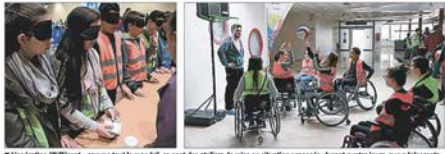
« L'opération "Différent... comme tout le monde", au sein des ateliers de mise en situation proposés, durant quatre jours, aux adolescents. »